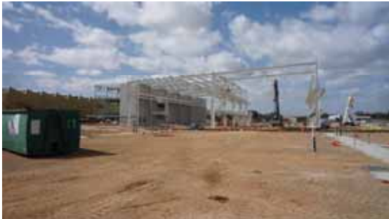
写真4-MLEI 社のメインプロジェクト Liebherr Para Hills

数か所の現場へ案内して頂きましたが、図面や報告書を参照した MLEI 社のメインプロジェクトである LIEBHERR Pada Hills(工業団地の建設)では、工場の建築工事・道路の排水施設設置工事や舗装工事の見学と設計変更の協議への同席をしました。週に1度は現場に赴き状況を確認し、何かあれば迅速な対応と的確な指示を行い、十分な信頼関係が構築されている様子が伺えました。