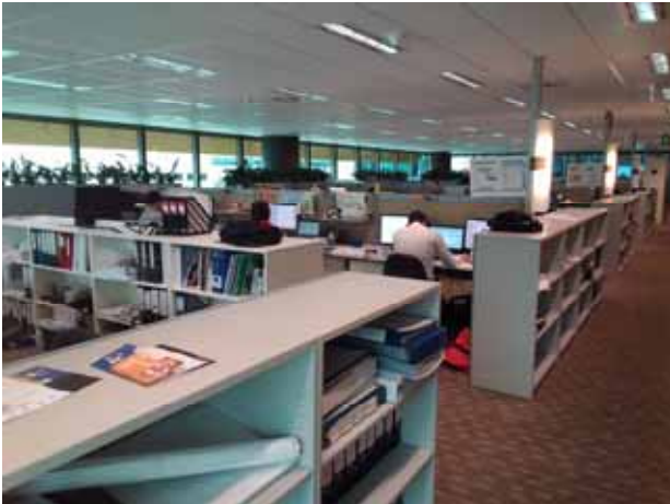
写真 1 オフィスの様子