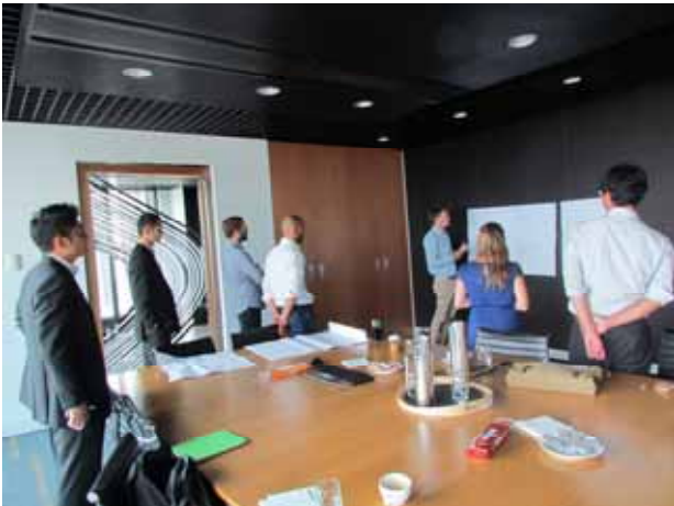
ファイナルサミット・ディスカッション

自身の深いところで何を得たのかについては本人のみ知るところであるが、心なしか皆の表情が