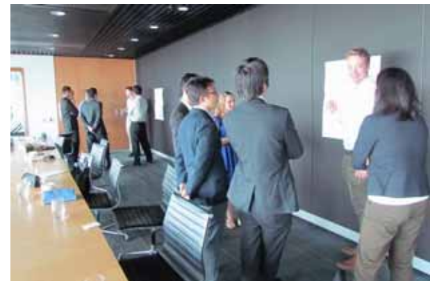
写真 3 グループディスカッションの様子

初めに日豪のエンジニアを取り巻く環境の相違点及び類似点についてブレインストーミングをおこないました。挙げられた内容で代表的なものは下記の通りです。