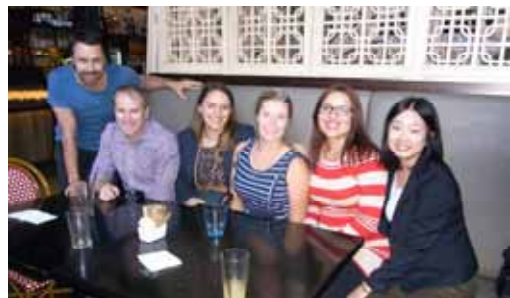
お世話になった部署の方々

また、ワークライフバランスについては、様々な意見はありましたが、休暇のとり方や平日の夜の過ごし方は非常に柔軟で、それぞれのライフスタイルに合った環境が整っているようでした。それが、仕事のモチベーションに繋がっているように感じました。日本の職場環境においても本研修の報告を通して、働く権利について考え直すきっかけづくりをしていきたいと考えています。