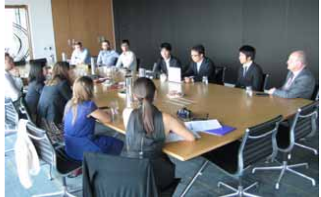
写真 2 フリートークの様子