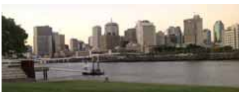
プリズベンの街並み

プリズベンとはオーストラリアの東海岸北部に位置するクイーンズランド州の州都で、近隣の地域を含めた都市圏人口は約 200 万人となり、オーストラリア第 3 の都市です。入植と開発が始まったのは 1840 年ころ、市制が敷かれたのは 1902 年で、都市としての歴史はまだ浅いものの、近年急速に拡大が進んでいます。気候は一年を通して温暖で、冬は乾燥しますが、夏には最高 30 度を超え雷雨もしばしば発生し、2010 年には大規模な洪水により市中心部が冠水する被害に見舞われています。統計によれば、通勤者の 70%は自家用車を使用し、バスと鉄道の分担がそれぞれ 7%ずつで、バイク・自転車が 2%程となっています。