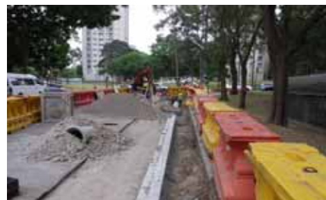
自転車専用道路建設現場

日本のまちづくりでも着目されている自転車専用道路の設計業務の現場検査に立ち会いました。シドニー市でもまちの一大事業として整備が進められており、CBD エリアでは既にスーツにヘルメット姿で通勤する姿も多く見られました。