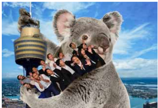
シドニータワー・アイ

Thank you very much for your hospitality & organizing enjoyable events in Australia.