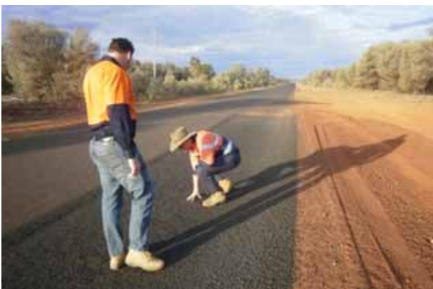
写真 2 施工不良がないか、約 100 km に渡り点する施工箇所を回ってチェック