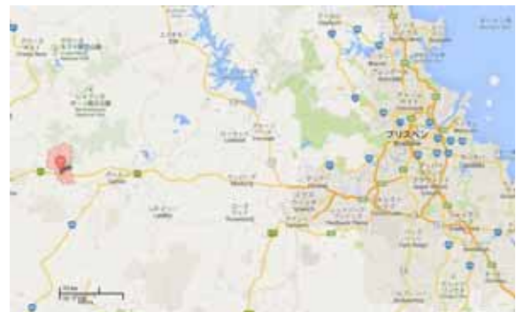
図1 見学場所の位置図

現場見学として、2011年に洪水被害を受けた Helidon ~ Withcott 周辺の被害調査に同行しました。現場は Brisbane から車で一時間以上かかり、ところどころに町があるものの大部分は牧場やブッシュランドとなっている典型的なオーストラリアの風景でした。