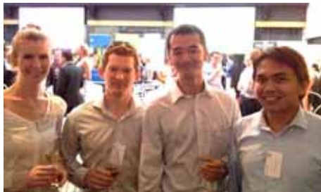
Consult Australia のイベントにて同僚と

平日の 17 時には社員の 7 割が帰宅し、アフター 5 には趣味に励んだり、友達と飲みに行ったり、家族とゆっくり時間を過ごしたり等、皆思い思いにプライベートの時間を楽しんでいます。