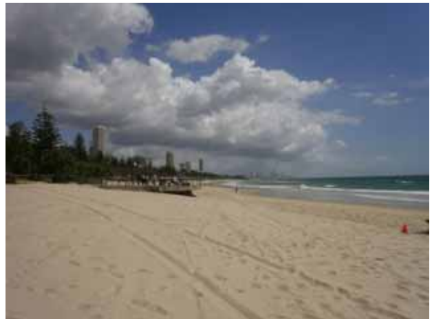
写真 3 ゴールドコーストの海