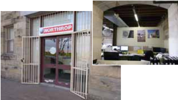
シドニー事務所の入り口、オフィス

ホストカンパニーは、シドニーをはじめ、豪州東海岸に複数の事務所を有する Northrop Consulting Engineers Pty Ltd. でした。事務所はシドニーの中心業務地区（CBD）にあり、入植時代に建てられた保存建築を改装した建物でした。研修部署は、主に構造部門でしたが、訪問研修では複数の部署を回るなど、多くの方と関わる機会に恵まれました。シドニー事務所には、構造、土木や設備をはじめとする様々な分野の技術者が 70 名程在籍していました。