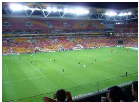
写真 3 サッカー観戦