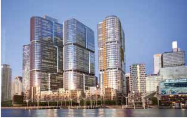
写真 4 Barangaroo Project 完成予想イメージ

シドニー支社では、オーストラリアで最大規模の延床面積 300,000m 2 超の Barangaroo Project の地区再開発事業が進んでおり、多くのスタッフがこのプロジェクトに携わっていました。