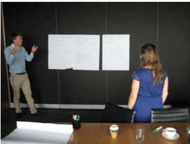
写真4 ディスカッションした内容の発表

今回のディスカッションでは、主として考えられる内容の列挙をおこないました。日豪交換研修に関係するすべての人にとって、このテーマについてディスカッションを重ねていき、今後参加する研修生とメンター個人だけでなく、それぞれの会社にとっても有意義なものにしていくことが重要なことであると感じました。