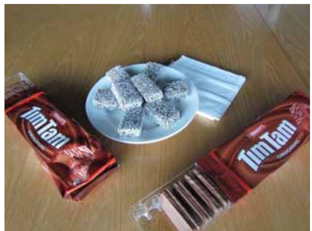
写真6 テーブルには日本でもお馴染みのお菓子

また、受入れ会社の皆様、特にメンターの方々には、日本から来たエンジニアに多くの時間を使得頂き、丁寧に業務の説明等をして頂きました。仕事後にも食事や飲み会、休日には観光に誘って頂き、とても楽しく過ごすことが出来ました。本報告書ではあまり書いてはませんが、フリートークでメンターの方と一緒に行った休日の観光の思い出話が多く聞かれ、公私共に充実した研修だったことがよく伝わってきました。