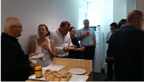
写真3-キッチンでの TeaTime の様子