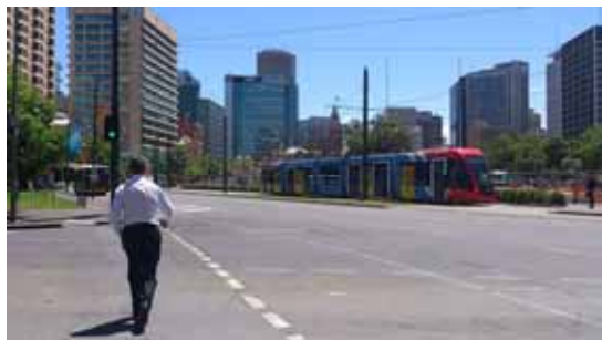
写真 1-アデレードの中心にある Victoria Square 前を通過するトラム

南オーストラリア州の州都であるアデレードは、日本ではあまり知られていない都市ですが、豪州の第 5 番目の都市で文化と芸術の都として知られています。中心地は碁盤の目のように整備がなされ、古い建物や公園も多く街並みも美しいという印象です。人口は 100 万人程度で、アジア人種が多いものの、日本人は少数派で他の都市に比べ少なく、街では 1 度しか出会いませんでした。