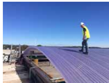
ショッピングセンターの 屋根の視察

な場所に連れ出してもらった。引率してくれる人もほぼ毎回違っており、このおかげでオフィスのほとんどの人と仲良くなることができた。見るだけでも興味深かったが、何か少しでも自分の実になれば、と大学のときにかじった構造力学を少し復習してみようと思い、テキストを借りて学生気分勉強してみたりもした。普段の業務であまり触れることのない構造設計の部分を学ぶにあたり、この座学と実学の組み合わせはよかったように思う(英語の勉強にもなる)。また、顧客やその他ステークホルダーとの調整役、という日本でも変わらないコンサルタントの役割を目にした