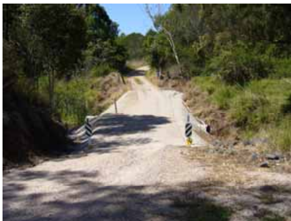
写真 1 被災現場の様子

被害調査はあらかじめ用意してある被害箇所リストに従って淡々と車でまわり写真を撮り、被害の残っているものについては復旧に必要な資材の量などを算出する、というものでした。すでに復旧が行なわれた場所もあれば土砂で埋もれた水路などもありました。