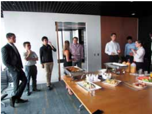
ウェルカムセレモニー