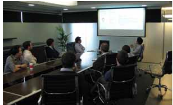
写真 7 プレゼンテーションの様子

また、シドニー支社とメルボルン本社それぞれで、主に日本のグリーンビルディングについてプレゼンテーションをおこないました。興味深く聞いて頂き、質問もたくさん頂き大変有意義な時間でした。質問の多くが建物外部の環境に配慮した仕組みであったことが印象的でした。