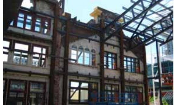
写真 6 Emprium Shopping Center のヘリテージファサードを残した改築

メルボルン本社では、私のメンターは 2 名となり、延床面積 86,000m 2 の New Bendigo Hospital Project チームのエンジニアと、MECHANICAL 部門のエンジニアで多くの現場視察同行をすることができ、実際の図面作成補助をおこないました。