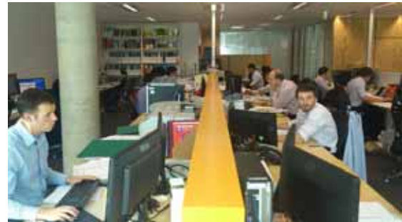
写真 2-オフィスの様子

昨年このオフィスに引越してきたばかりで、机は列ごとに長い板が配置され隣の仕切りはなくても皆きれいに整頓されていました。