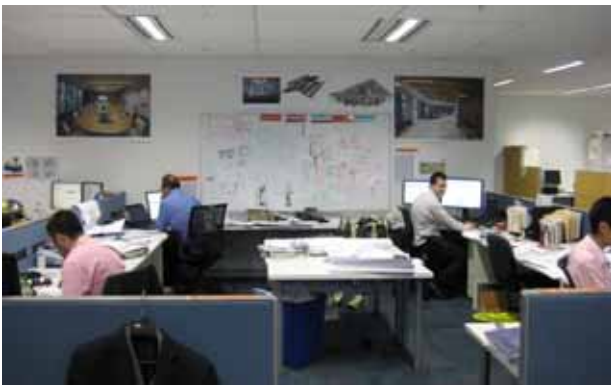
写真 5 シドニー支社の INTERIORS 部門 (一部)

私のメンターは INTERIORS 部門のエンジニアで Barangaroo の内装設計をしていたので、多くの図面を見ることができ、チルドビームを含めた機器の選定見直し補助をおこないました。