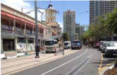
ゴールドコースト LRT 建設現場

5 か所の現場見学の内、最も興味深かったのは、ゴールドコーストの LRT システム建設でした。このプロジェクトは、ゴールドコースト市中心部を縦断し、北は病院および大学、南は空港と結節する全長 13km のクイーンズランド州初となる LRT で、最新の LRT システムの導入や、道路交通との連携、及び安全性の確保の点などから、非常にチャレンジングなプロジェクトです。