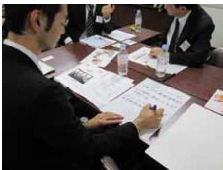
討論内容をまとめる