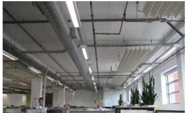
写真2 NDYメルボルン本社の内部見上げ

NDYでは年間ベストエンジニア等の表彰しており、その式に急遽出席することになりました。その名も「EXCELLENCE Awards 2013」、まるでテレビ放映されるのかというような華やかな光景にスケールの大きさを感じ、世界に広がる支社の交流を図ることができ、スタッフのモチベーションにも大きく影響していると感じました。