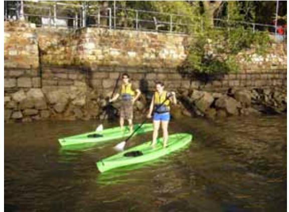
写真 2 パドルボード(ブリスベン川)

週末についてはメンターのSamanthaがホームステイやブリスベン観光など様々な活動を用意してくれたため、常に新しい発見と楽しみがありました。