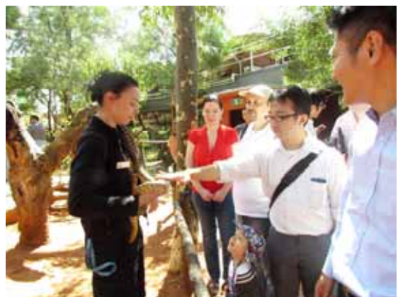
シドニー・ワイルドライフ