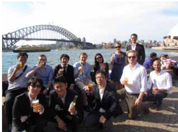
オペラハウスにて、ハーバーブリッジを背景に