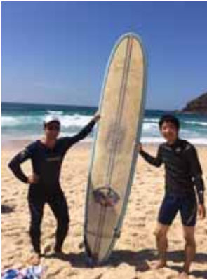
サーフィンに挑戦

トラリアの若者事情について話し込んだりと、あたたかい家庭の雰囲気なかで、職場ではできないような話をすることができた。