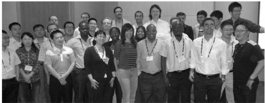
YPMTP 12 Young Professionals

そのプログラムにはアジア、アフリカ、ヨーロッパ、北アメリカおよびオーストラリアを含めた文字通り世界中からのプロフェッショナル・エンジニアにより構成されるチームが参加した。これはそれだけでも貴重な機会である。その研修プログラムは全体のグループを3つのサブグループへ分割することから始まり、Podioと呼ばれる非常に効率的なインターネットベースのフォーラムで各グループがバーチャルセッションを行なった。これらのバーチャルセッションは3~4週ごとに行なわれることになっていた。各セッションではファシリテーターにより提示されたケーススタディについて議論した。そのプログラムで示された事例は、我々がプロフェッショナル・エンジニアとして直面するコンサルティング会社の編成、人事管理、事業開発、財務管理、クライアント関係、リスクマネジメント、持続可能な開発、品質管理、およびビジネス公正管理等の実際のケーススタディを反映したものであった。グループメンバーはCE業界のフレームワークの下、様々な背景を持ち、様々なことを行っていたため、セッションはとりわけ非常に有用であり啓発的なものであった。