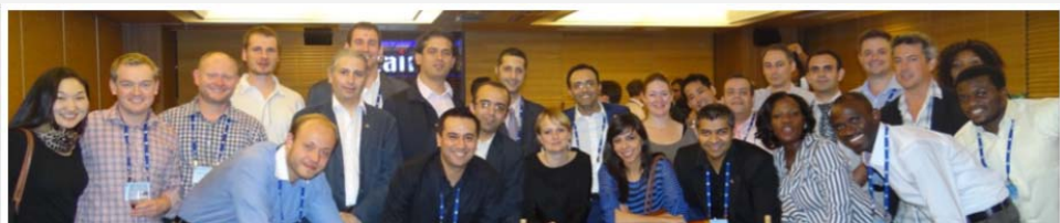
YPs at the the korean traffic management centre