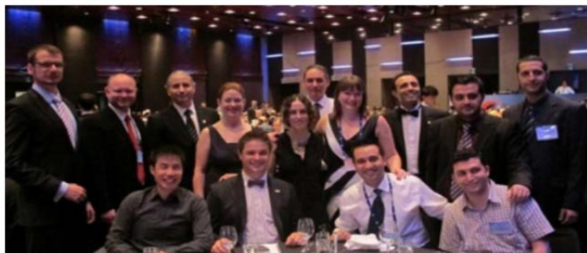
YP Delegates at the Gala Evening