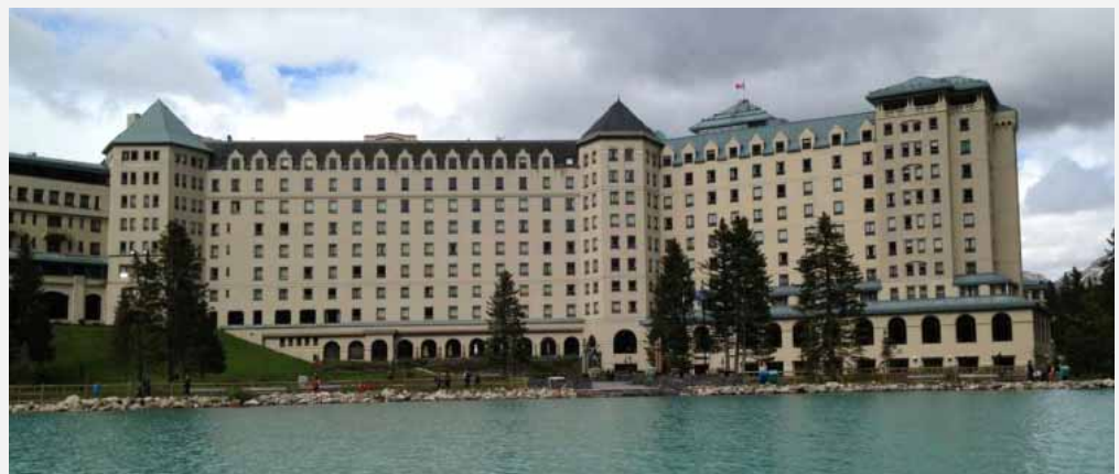
ACEC カナダ 2013 サミット、ルイーズ湖 (アルバータ)

カナダの主要産業の繁栄を維持するための、迅速かつ最も効率的な方法であると相互に理解されるよう、今後数年間、YPN は連邦政府とのこのユニークな意見交換の試みを継続していく予定である。