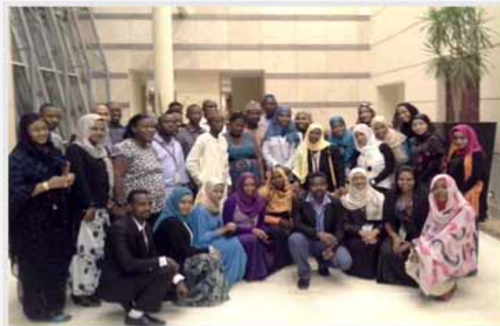
スーダンで開催された 2013 年会議に出席した数名のアフリカ人若手専門職達

運営委員会は月に一度オンラインでの会合を継続して行い、彼らのビジネスプランを発展させてきた。この委員会の狙いは、GAMA コミュニティーにおいて若手専門職に向けた強く統一的な声明を続け、若手を成長させるためのフォーラムを提供しながら FIDIC 及び GAMA 会議の際に直接会い、国内外における表現を見つけ、世界各国の専門家との関係を築くことであり、将来の信頼できるアドバイザーや業界の指導者として、彼らが地域社会へ責任を果たすことを目的としている。